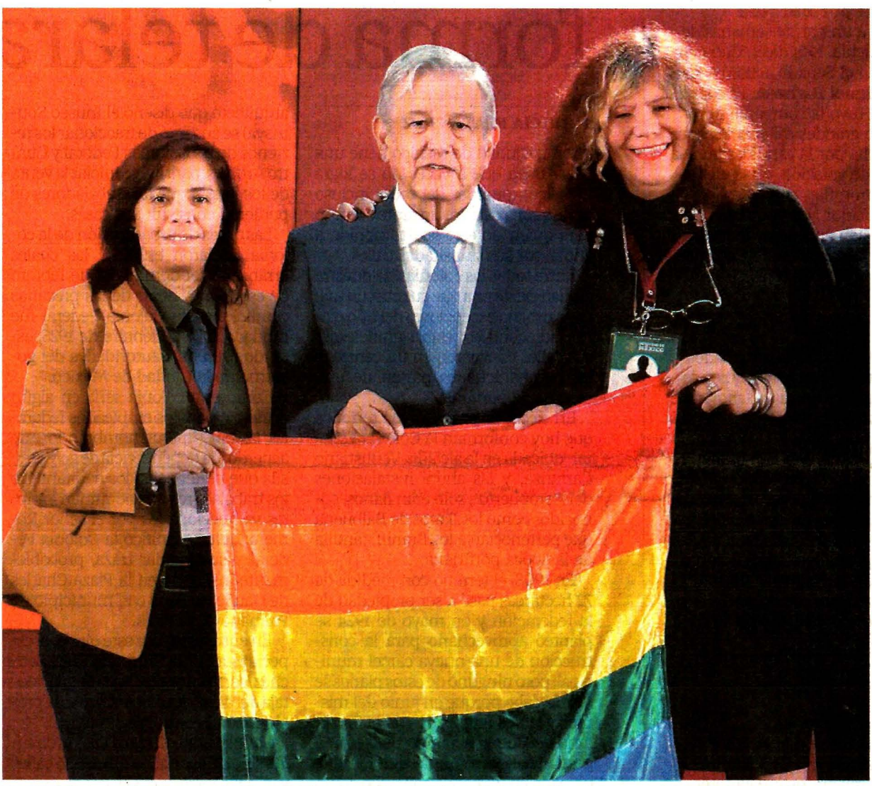
En el Día Internacional contra la Homofobia, el presidente López Obrador afirmó que su gobierno no permitirá la discriminación. Durante la conferencia sostuvo, junto con activistas, la bandera de la comunidad LGBTTTTI.

Sobre las cifras que dio a conocer el Instituto Nacional de Estadística y Geografía (Inegi), acerca del aumento de un millón 886 mil personas de-