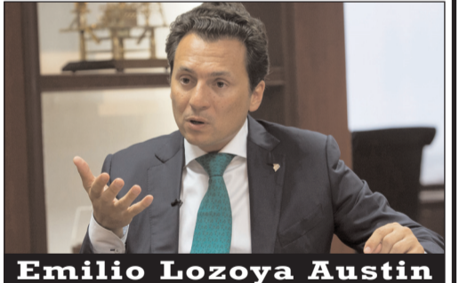
Emilio Lozoya Austin