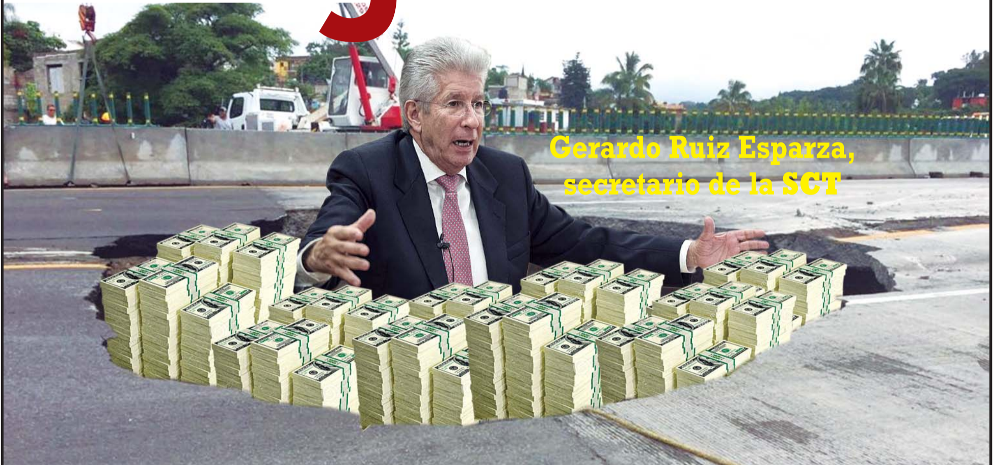
Gerardo Ruiz Esparza, secretario de la SCT

La Secretaría de la Función Pública concluyó la auditoría a la obra del Paso Exprés de Cuernavaca, Morelos, en la que detectaron 22 irregularidades , que suman más de mil millones de pesos. P. 13