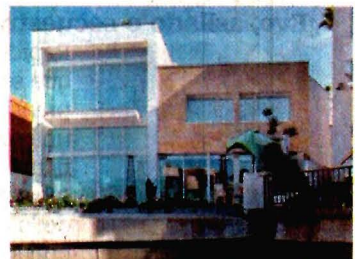
La casa tiene vistas panorámicas y dos muelles para botes.

Si se toman en cuenta las 2 mil 991 muertes violentas de diciembre de 2018, mes en el que asumió el cargo el presidente Andrés Manuel López Obrador, se rebasan las 30 mil víctimas. NACIÓN A8