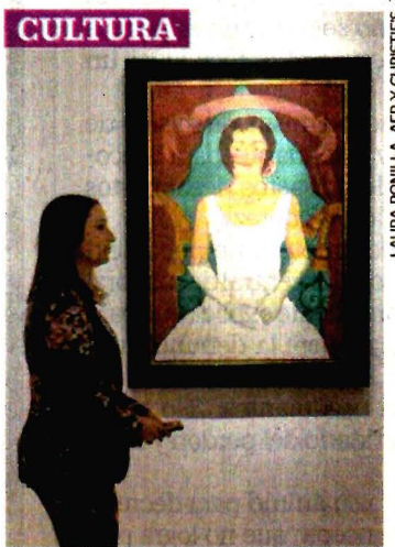
LAURA BONILLA, AFP Y CHRISTIES

QUÉ HACER DIVERSION DEL FUTURO Lugares que harán que vuele tu imaginación y te sientas como en una película de ciencia ficción. C1