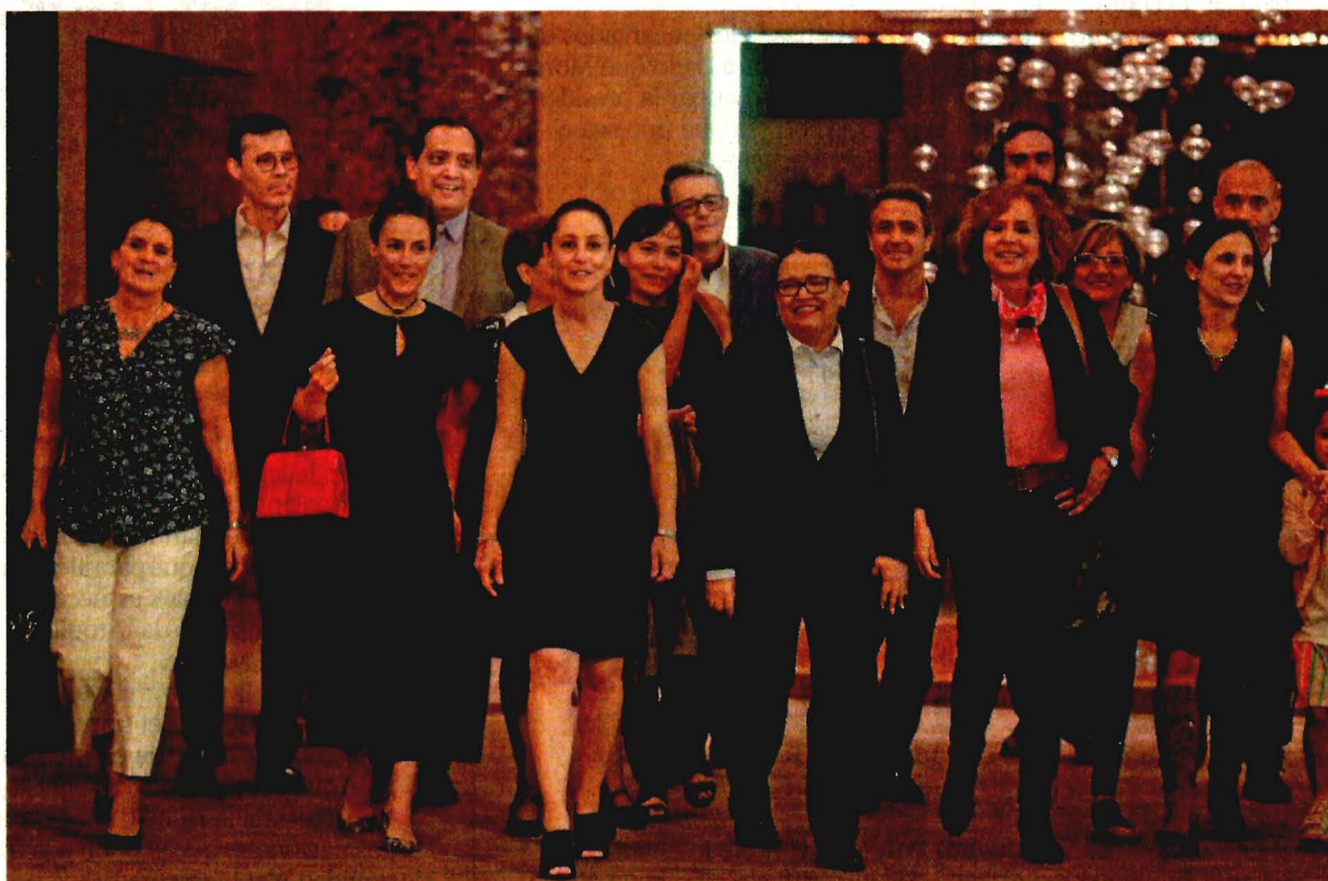
Claudia Sheinbaum, virtual jefa de Gobierno electa de la Ciudad de México, presentó a algunos de los integrantes del que será su gabinete, quienes en su mayoría son ex funcionarios capitalinos y académicos.