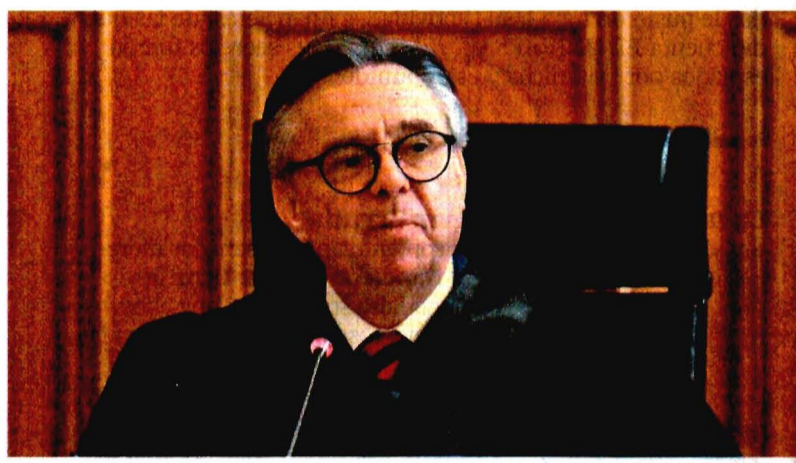
Eduardo Medina Mora fue designado ministro en marzo de 2015, por el entonces presidente Enrique Peña Nieto, y su periodo concluía hasta 2030.

de la disolución de la Suprema Corte en diciembre de 1994. Una vez concluido el trámite, el titular del Ejecutivo podrá enviar una terna para designar un nuevo ministro. Con ello, en menos de un año, el presidente López Obrador tendrá la oportunidad de colocar un tercer integrante en el pleno de la Corte. Este diario reportó en su sitio digital la renuncia, unos minutos después, de quien durante 20 años ha ocupado cargos en los más altos niveles del país, cruzando las dos alternancias en el Poder Ejecutivo. NACIÓN A10 y A11