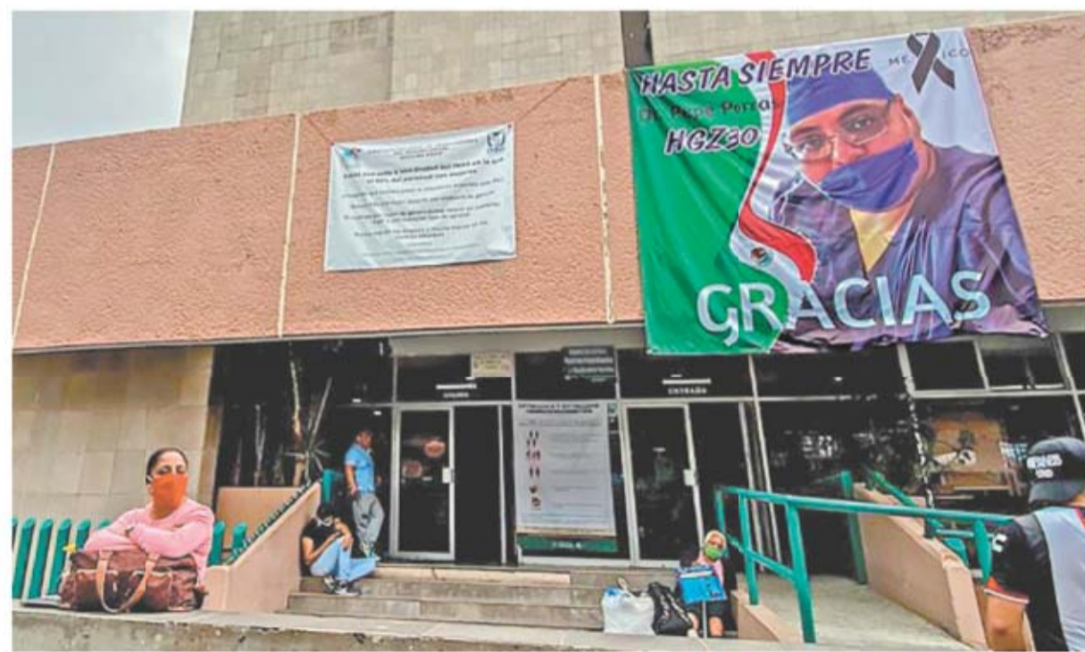
Pepe era médico cirujano y estaba adscrito al área de Urgencias del Hospital General 30 del Seguro Social.