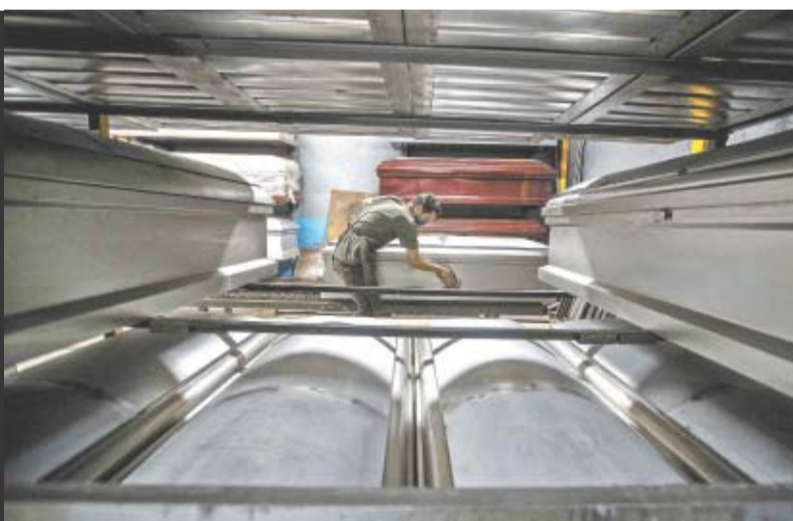
GERMÁN ESPINOSA. EL UNIVERSAL

● Servicios funerarios se incrementan 400%. A6