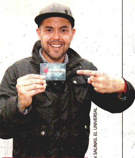
AGUSTÍN SALINAS, EL UNIVERSAL

La voz del poeta fue grabada por Bonifacio Fernández Aldana para la Biblioteca Panamericana del Sonido. E9