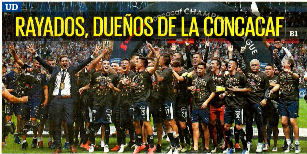
RAYADOS, DUEÑOS DE LA CONCACAF B1