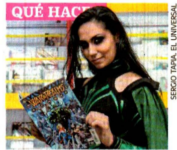
QUÉ HACER PARA SENTIRSE UN SUPERHÉROE Recorre sitios ideales para los amantes de historietas en el Día del Cómic. C1