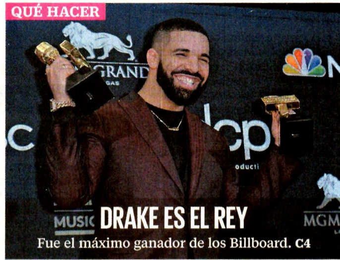
QUÉ HACER MUSIC DRAKE ES EL REY Fue el máximo ganador de los Billboard. C4