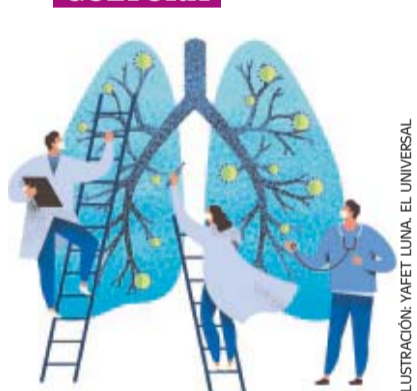
ILUSTRACIÓN: YAFET LUNA. EL UNIVERSAL