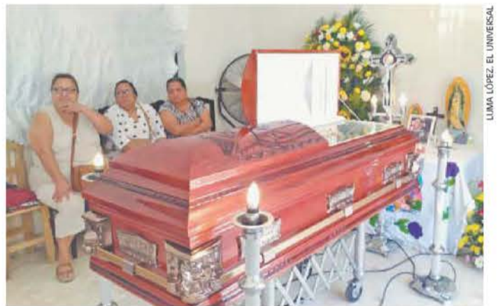
LUMA LÓPEZ. EL UNIVERSAL

● Al menos una persona ha muerto en el Hospital Regional de Pemex de Villahermosa por un medicamento contaminado, de acuerdo con la petrolera. Familiares de los pacientes reportan más víctimas. A25