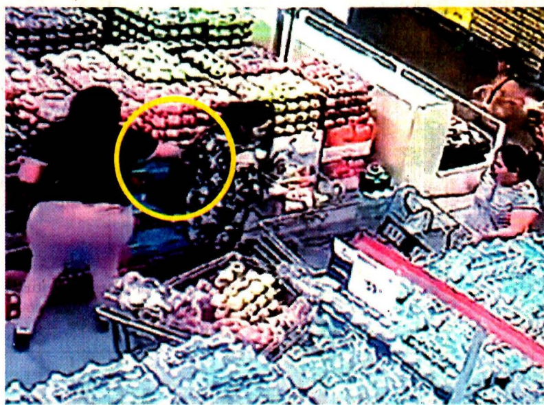
TOMADA DE VIDEO

Un video que circula en redes muestra cómo a la víctima le cierran el paso con carritos, mientras una mujer le saca la cartera del bolso.