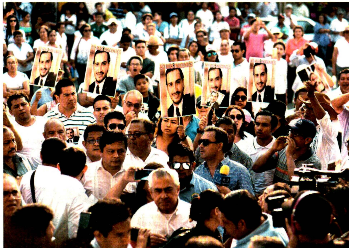
Con la consigna ¡No más inocentes!, se llevó a cabo la marcha para exigir justicia por el asesinato de 13 personas. Reclamaron a las autoridades que no fue un ajuste de cuentas entre criminales, sino que era una fiesta familiar.