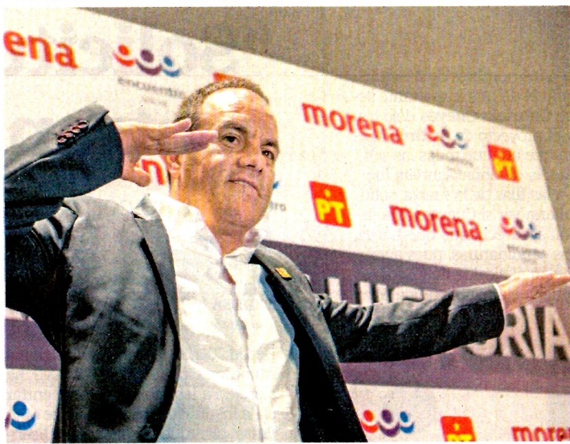
El ex futbolista Cuauhtémoc Blanco, alcalde de Cuernavaca, disputará la candidatura a gobernador de Morelos por Morena, PT y PES.