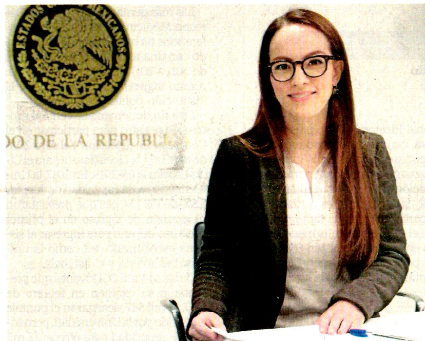
La senadora Gabriela Cuevas Barrón renunció a 23 años de militancia en el PAN y anunció que se unirá al movimiento de Andrés Manuel López Obrador.