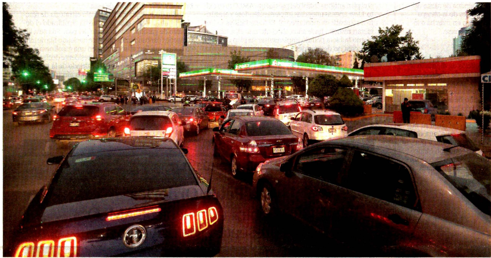
Ante el miedo de quedarse sin combustible, automovilistas hicieron largas filas para abastecerse en gasolineras de la capital del país.