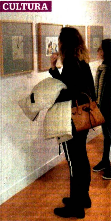
LUIS MÉNDEZ, EL UNIVERSAL