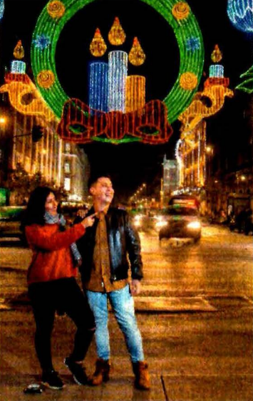
SERGIO TAPPA, EL UNIVERSAL