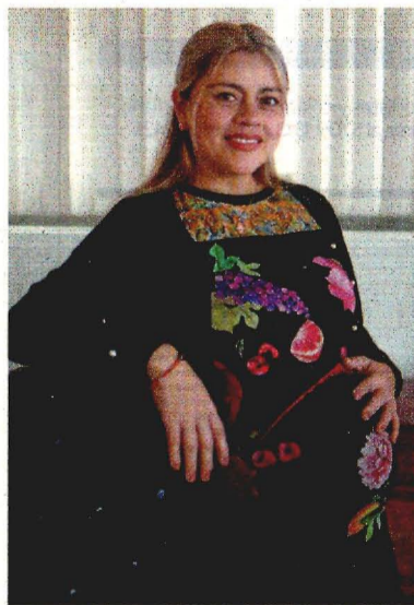
ALEJANDRA LEIVA, EL UNIVERSAL