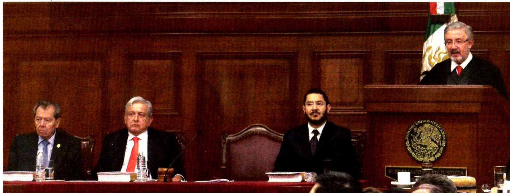
Representantes de los poderes Ejecutivo, Legislativo y Judicial estuvieron en el último informe de labores del presidente de la Corte, el ministro Luis María Aguilar.