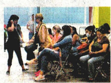
Familiares en el Semefo de Jalisco.

● En un año, aumenta en 1.2 millones la cifra de delitos. A11