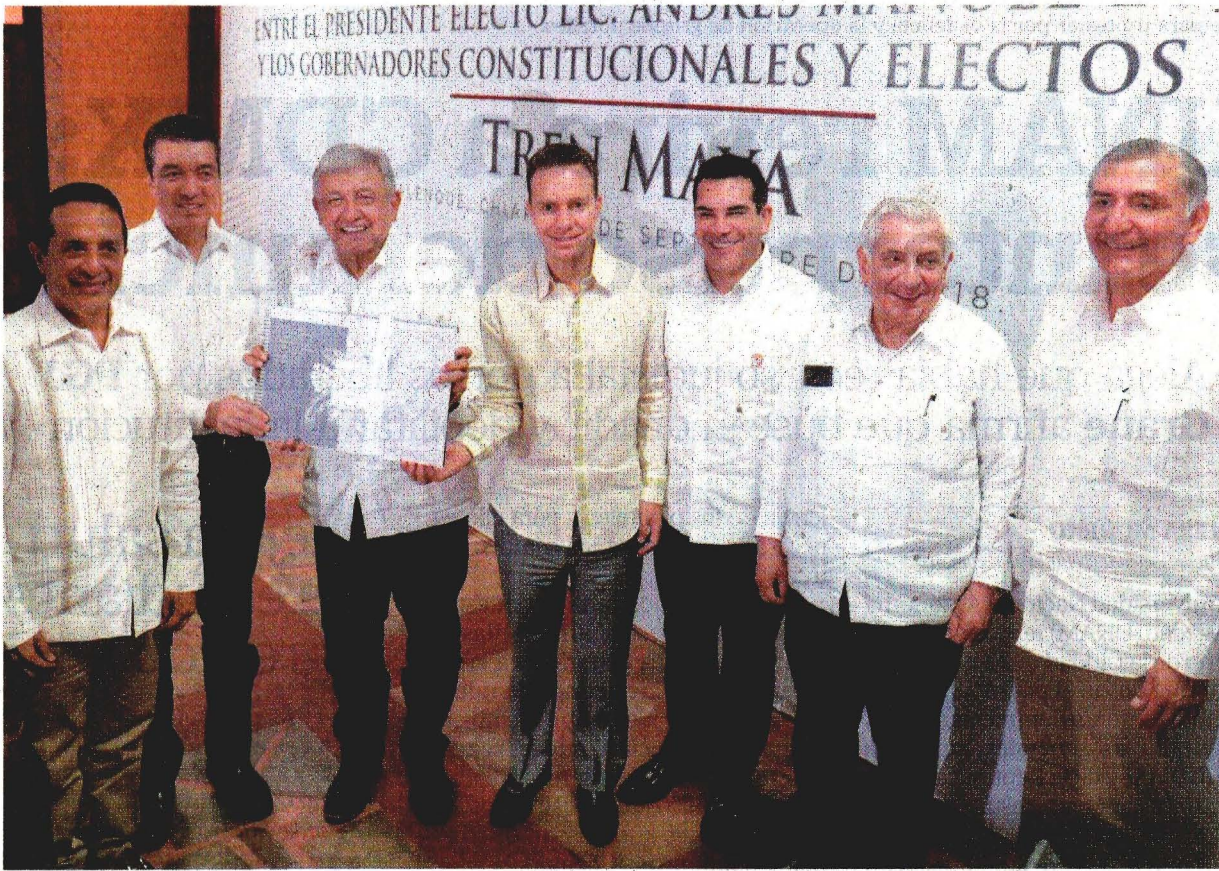
El presidente electo Andrés Manuel López Obrador se reunió con mandatarios, tanto en funciones como electos, del sureste del país para presentar el anteproyecto del Tren Maya.

AL PAÍS LE ESPERA UN FUTURO LUMINOSO, DICE EL CANTAUTOR CUBANO PABLO MILANÉS. E1