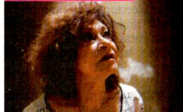
IRVIN OLIVARES, EL UNIVERSAL