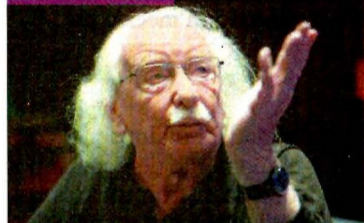
ALEJANDRA LEIVA, EL UNIVERSAL