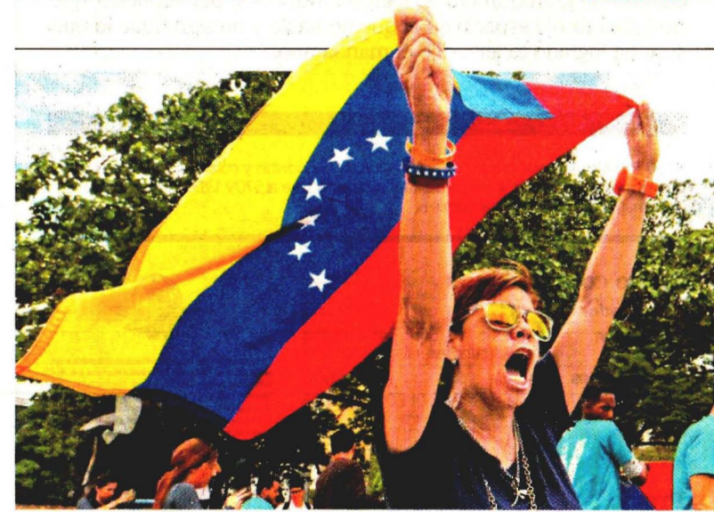
Oposición rechaza llamado del presidente Maduro a negociaciones. A22