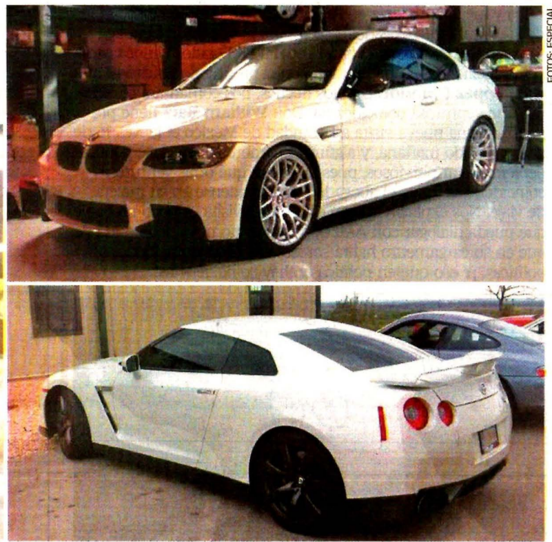
NACIÓN A5 Napoleón Gómez Casso presume en redes sociales al menos 31 vehículos, cuyo precio de venta parte de los 2 millones de pesos cada uno.