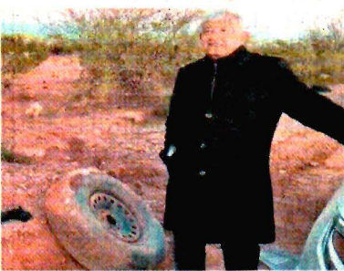
TOMADA DE VIDEO