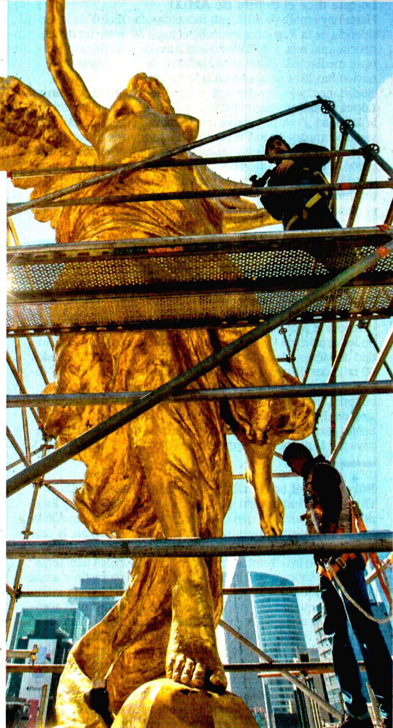
GERMÁN ESPINOSA. EL UNIVERSAL

● ¿Por qué persiste la extorsión telefónica? Alejandro Hope. A9