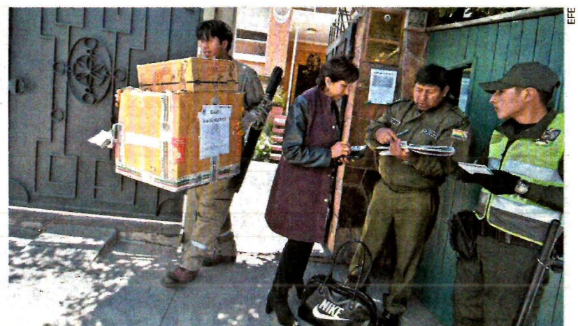
Imagen del 23 de diciembre que muestra a miembros de la policía boliviana en el acceso de la embajada de México en La Paz.

El gobierno de Bolivia, por su parte, exigió a México entregar a varios exministros de Evo Morales que se encuentran en la embajada para que enfrenen a la justicia. Indicó que no permitirán que nadie “ayude a fugitivos” a abandonar el país. NACIÓN A4