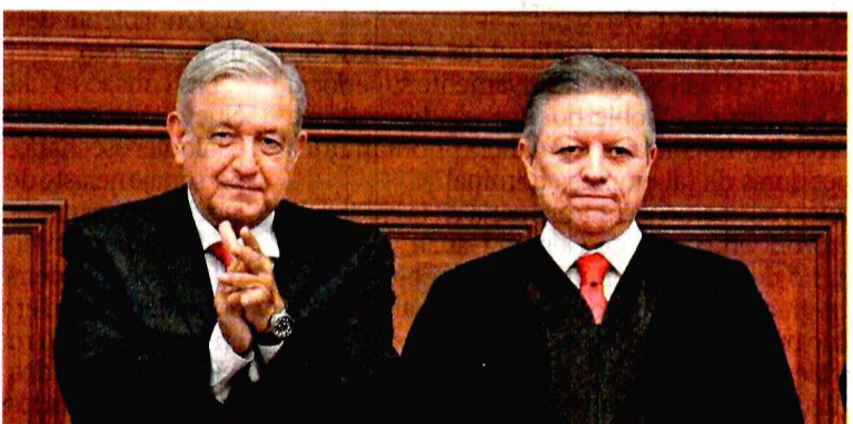
El presidente López Obrador aplaudió de pie al ministro Zaldívar cuando dijo que el Poder Judicial debe dar voz a los que no la tienen.

Dijo que la corrupción y el nepotismo se alimentan de la impunidad, que mucho tiempo los ha