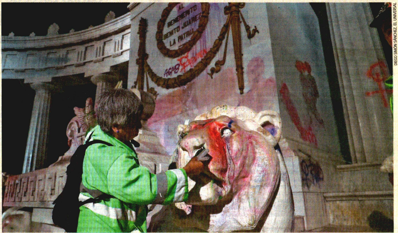
Trabajadores del gobierno limpian el Hemiciclo a Juárez, uno de los monumentos que fue vandalizado por encapuchadas durante la marcha. A32

● Al alza, delitos sexuales y feminicidios. A25