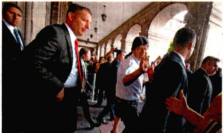
En todo momento, el exmandatario de Bolivia Evo Morales estuvo acompañado de escoltas, entre ellos algunos que cuidaban a Peña Nieto.