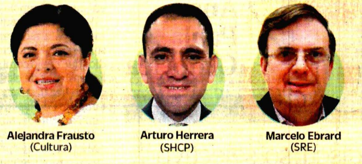
Alejandra Frausto (Cultura)