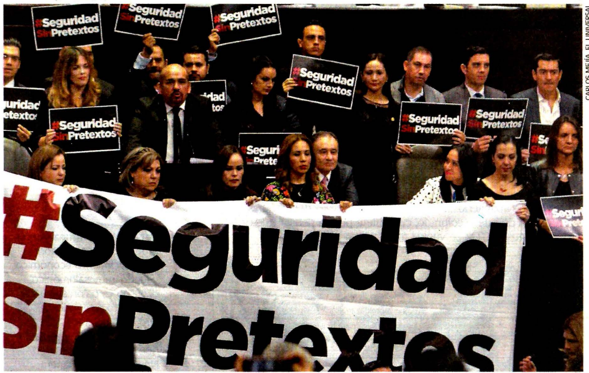
Los panistas tomaron la tribuna en la Cámara de Diputados durante la comparecencia del secretario de Seguridad y Protección Ciudadana, Alfonso Durazo. Con cartulinas y una gran manta exigieron seguridad.