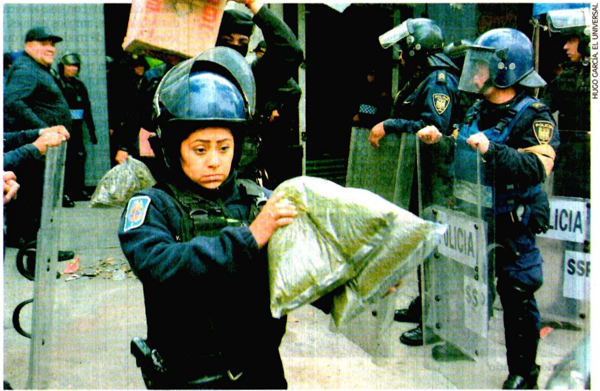
En el operativo fueron asegurados 2.5 toneladas de marihuana, 50 kilos de precursores químicos, 20 kilos de cocaína y 4 kilos de metanfetamina, además de 26 armas de fuego, un lanzagranadas y 20 granadas.