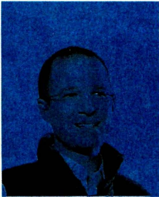
Ricardo Anaya (PAN-PRD-MC)