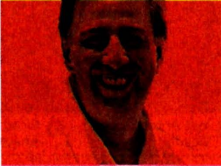
José Antonio Meade (PRI-PVEM-NA)