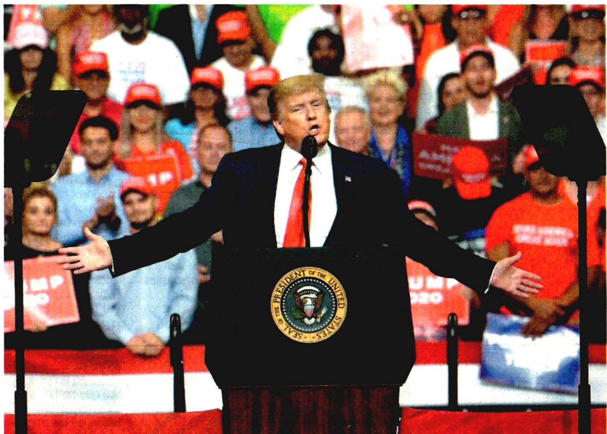
JOHN RACOUK, AP