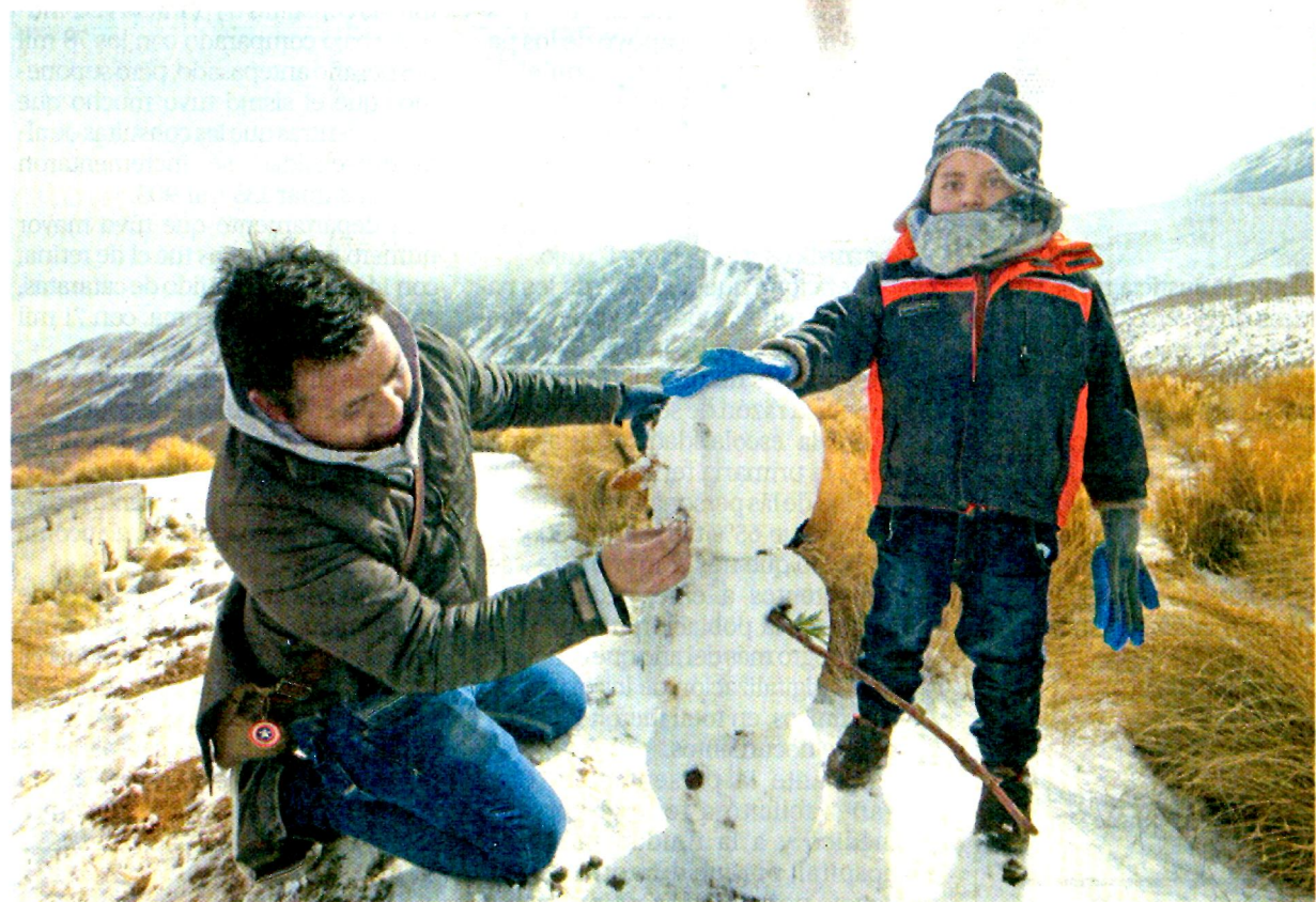
JORGE ALVARADO, EL UNIVERSAL

Con el descenso de la temperatura, cientos de personas acudieron al Nevado de Toluca, que se cubrió de blanco. Autoridades prevén que los frentes fríos continúen hasta la segunda quincena de marzo; en tanto, habitantes de la CDMX y el Edomex despertaron ayer entre lodo y escombros tras la granizada del miércoles, que dejó un muerto en Ixtapaluca al caerle el techo. C4 y C5