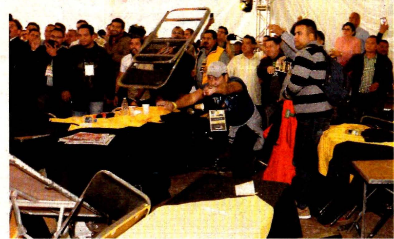
Integrantes de las corrientes del PRD se aventaron sillas y mesas, en el cierre de su 15 Congreso Nacional Extraordinario.