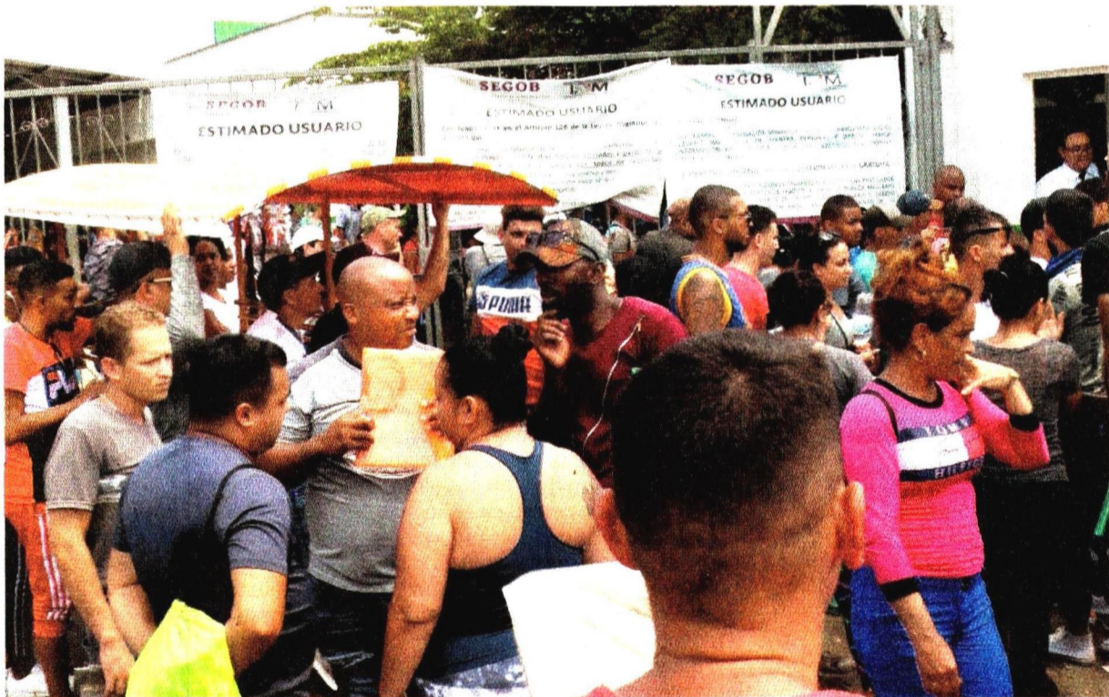
En medio de jaloneos, empujones y conatos de enfrentamiento con migrantes centroamericanos, alrededor de 300 cubanos ingresaron por la fuerza a las oficinas de regularización migratoria en Tapachula, Chiapas.