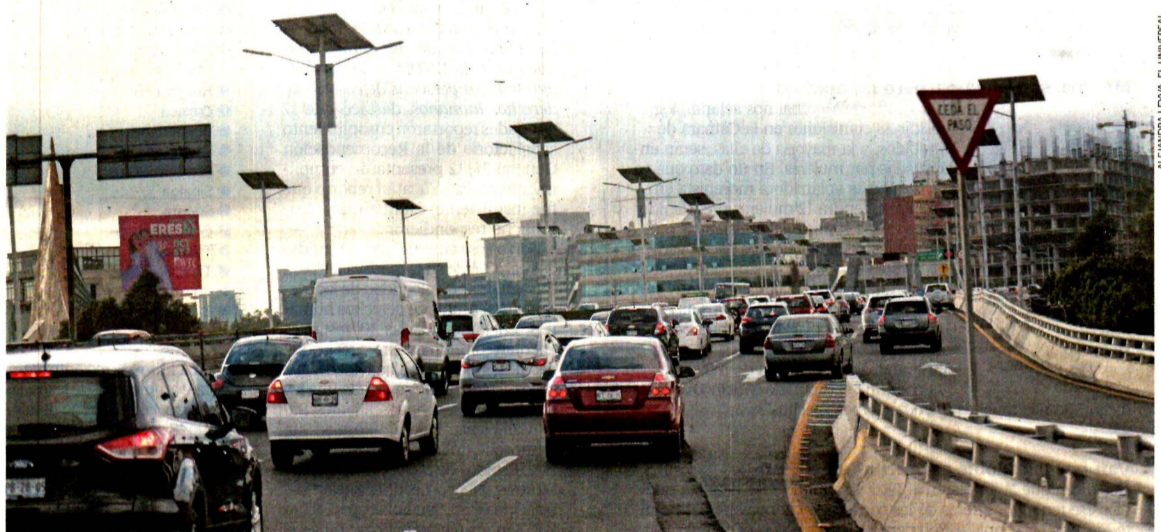
La Autopista Urbana Norte pasó de cobrar a 1.37 pesos el kilómetro en 2011 a 6.22 pesos en 2018, es decir, la tarifa creció 454%.