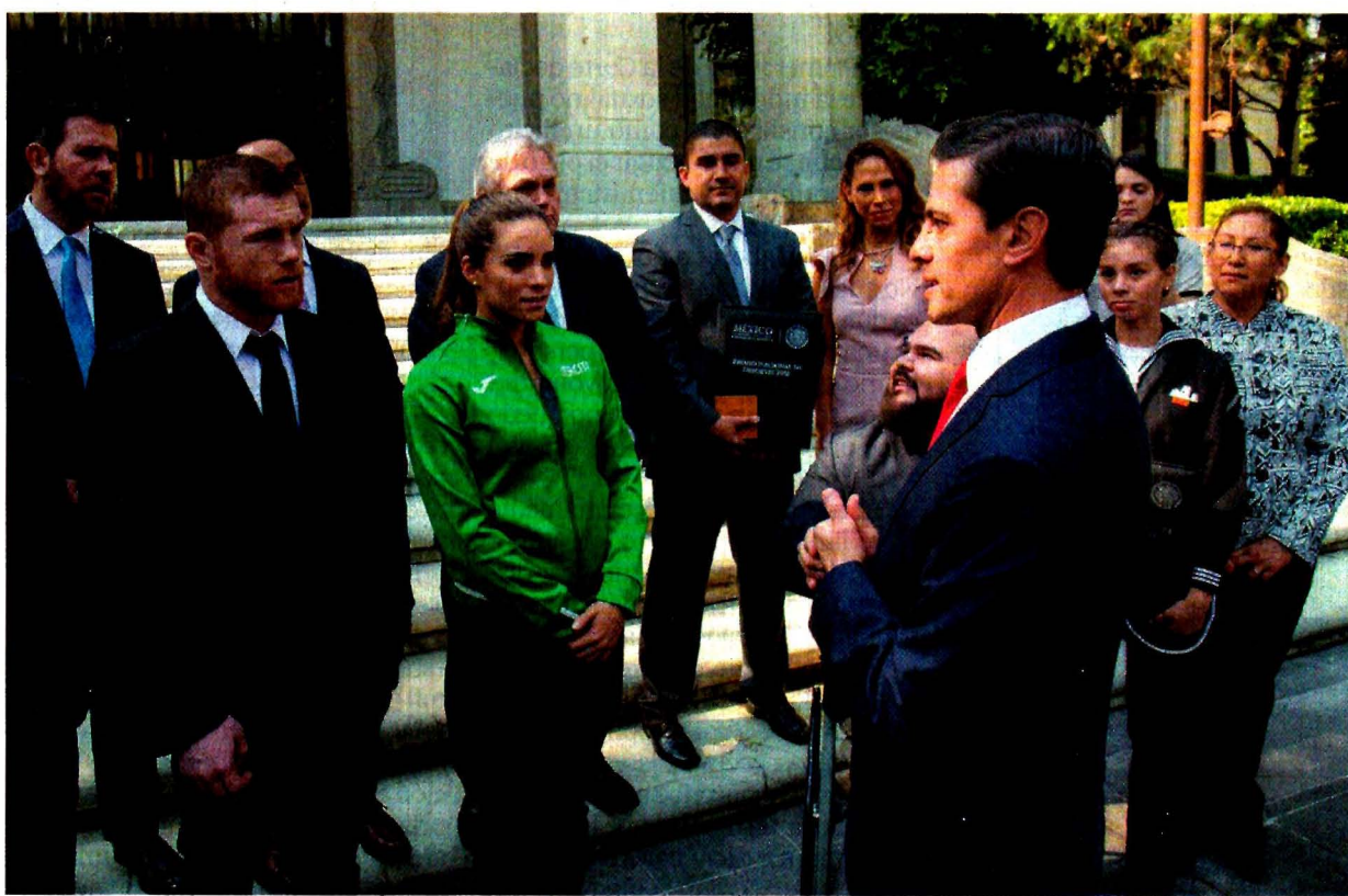
El presidente Enrique Peña Nieto recibió en Los Pinos a los ganadores del Premio Nacional de Deportes y el Premio Nacional de Mérito Deportivo 2018, entre los que se encuentra el boxeador Saúl Canelo Álvarez.