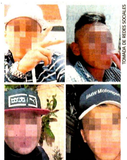
Los Malankins operan en Miguel Hidalgo, según las autoridades.

Se trata de cinco jóvenes que apenas rebasan la mayoría de edad y se dedican al robo en todas sus modalidades, narcomenudeo y a la extor-