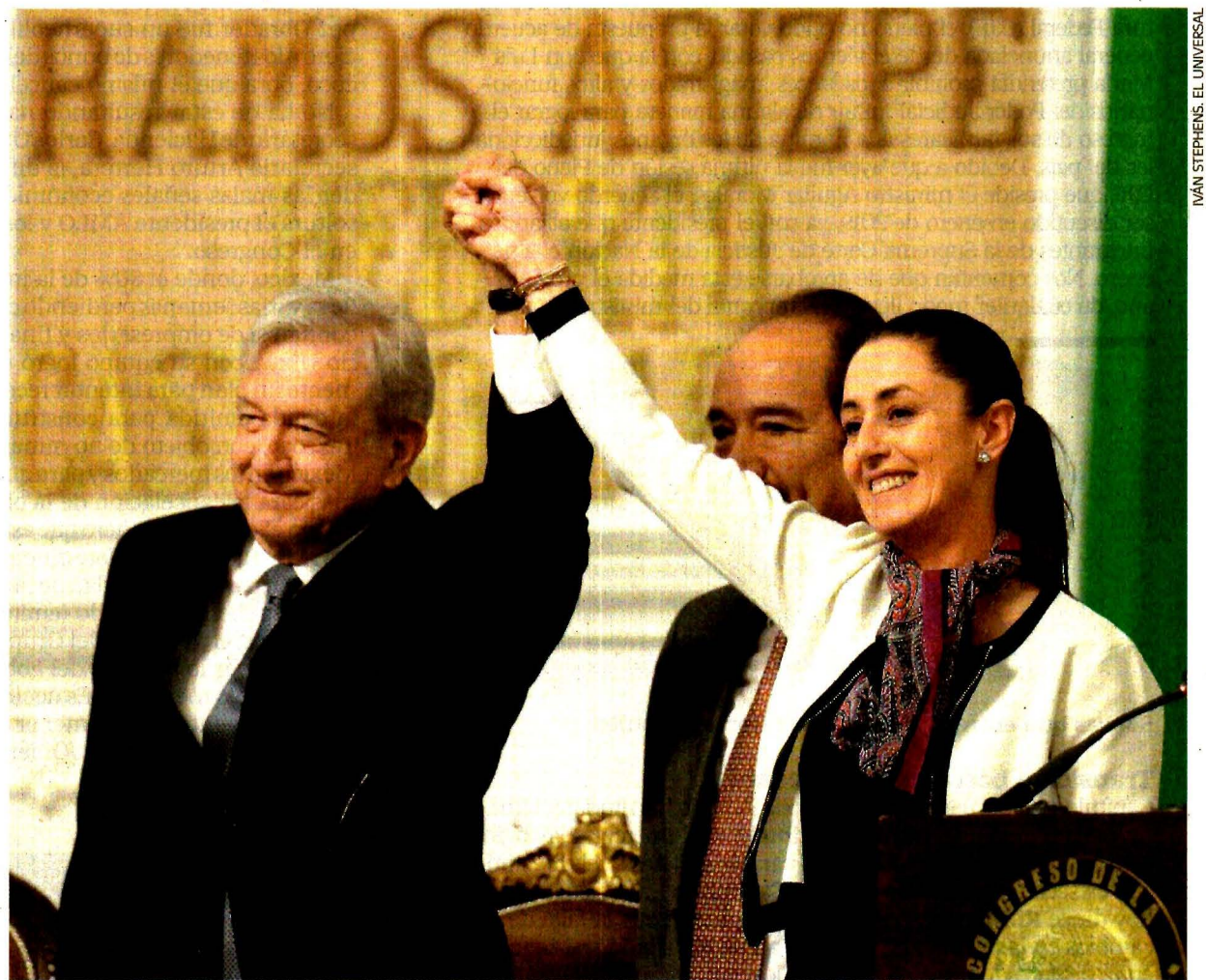
De la mano del presidente Andrés Manuel López Obrador, Sheinbaum inició su gestión como la primera mujer electa que gobierna la Ciudad de México. Aseguró que a partir de ahora se restablecen la democracia y la libertad política.