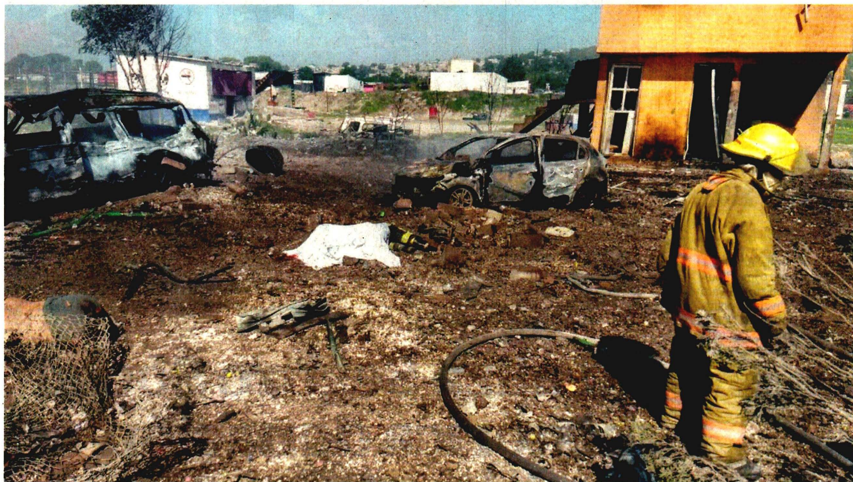
La tragedia volvió a presentarse en La Saucera, con la explosión de un taller de pirotecnia. Es el segundo accidente mortal en esa localidad en menos de un mes.