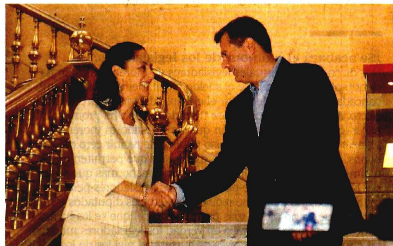
Sheinbaum y Amieva se reunieron en el Antiguo Palacio del Ayuntamiento.