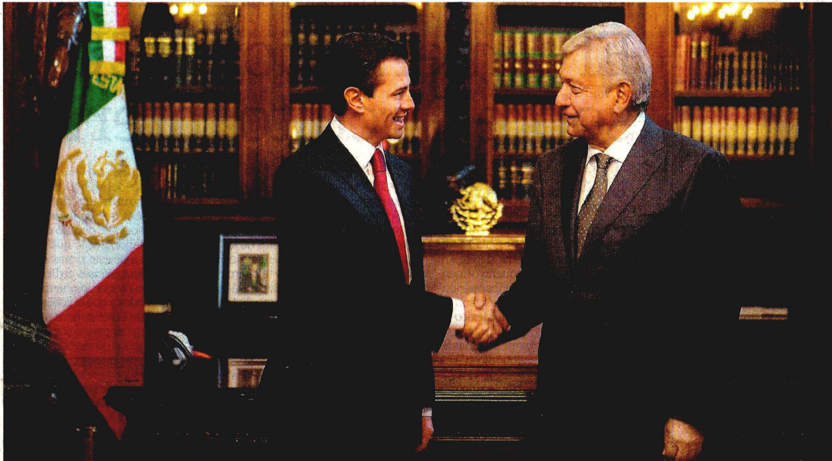
Fronte a la silla del águila, el presidente Enrique Peña Nieto y el virtual sucesor presidencial, Andrés Manuel López Obrador, estrecharon manos.