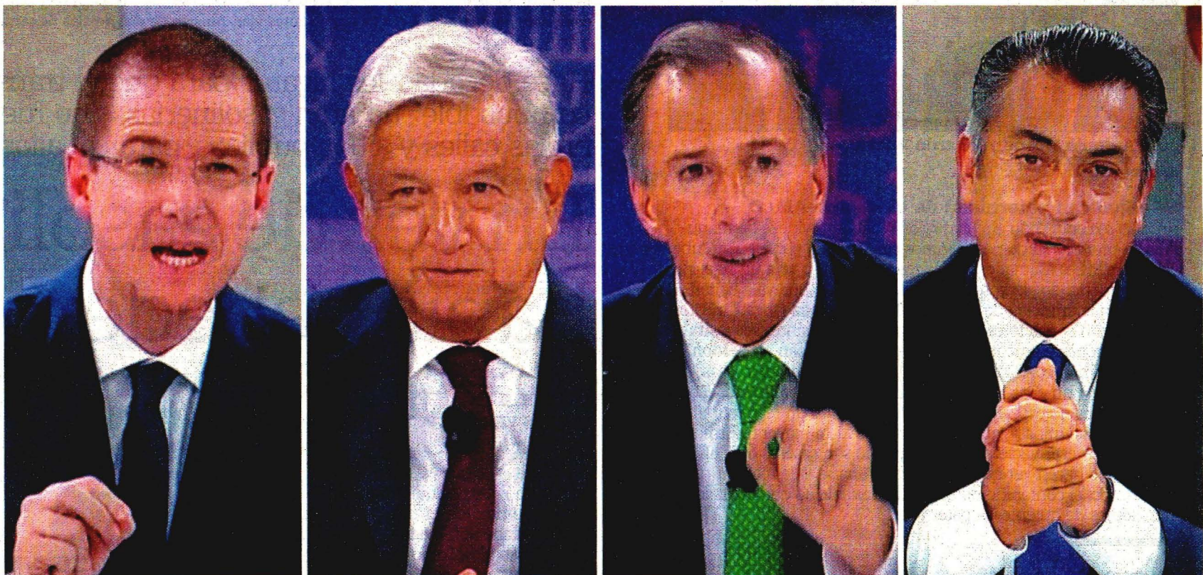
Momentos del tercer y último debate entre candidatos presidenciales; inicia la cuenta regresiva rumbo a la elección del 1 de julio.

López Obrador dijo que el verdadero pacto de Ricardo Anaya es con Peña Nieto, pero que ahora se pelearon. Aclaró que no es su fuerte la venganza, "es justicia, y ni a ti te voy a meter