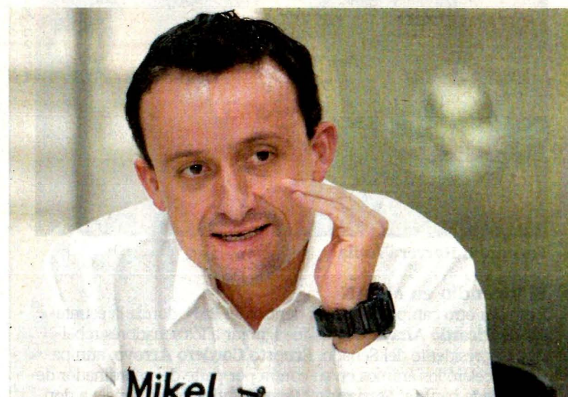
Arriola aseguró que los programas sociales no han funcionado en la CDMX.

Al participar en un foro organizado por EL UNIVERSAL, Arriola ad-