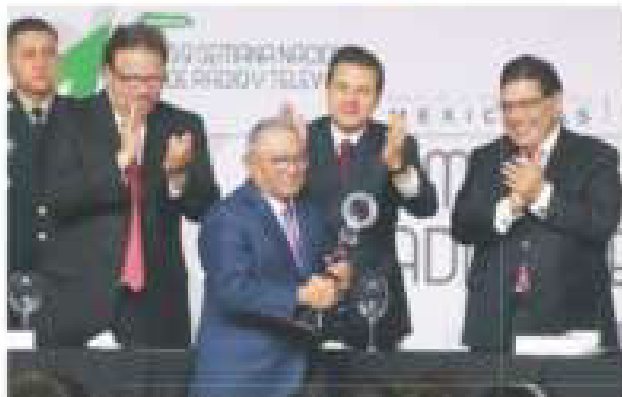
El presidente Enrique Peña Nieto aseguró que la misma política pública que se va a poder poner en una democracia es la intolerancia...