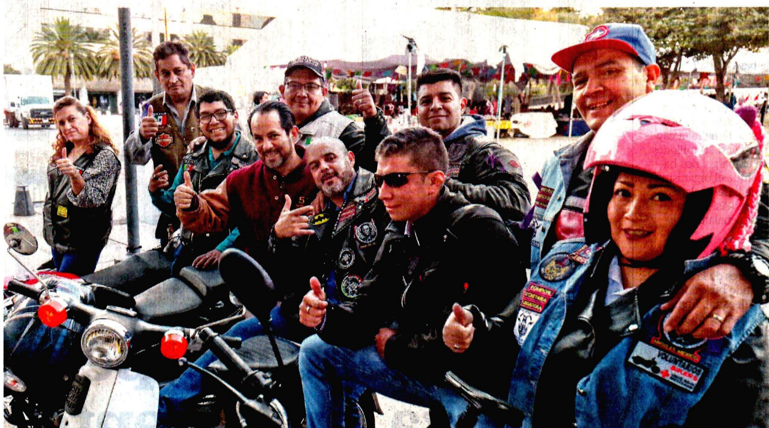
DIEGO SIMÓN, EL UNIVERSAL