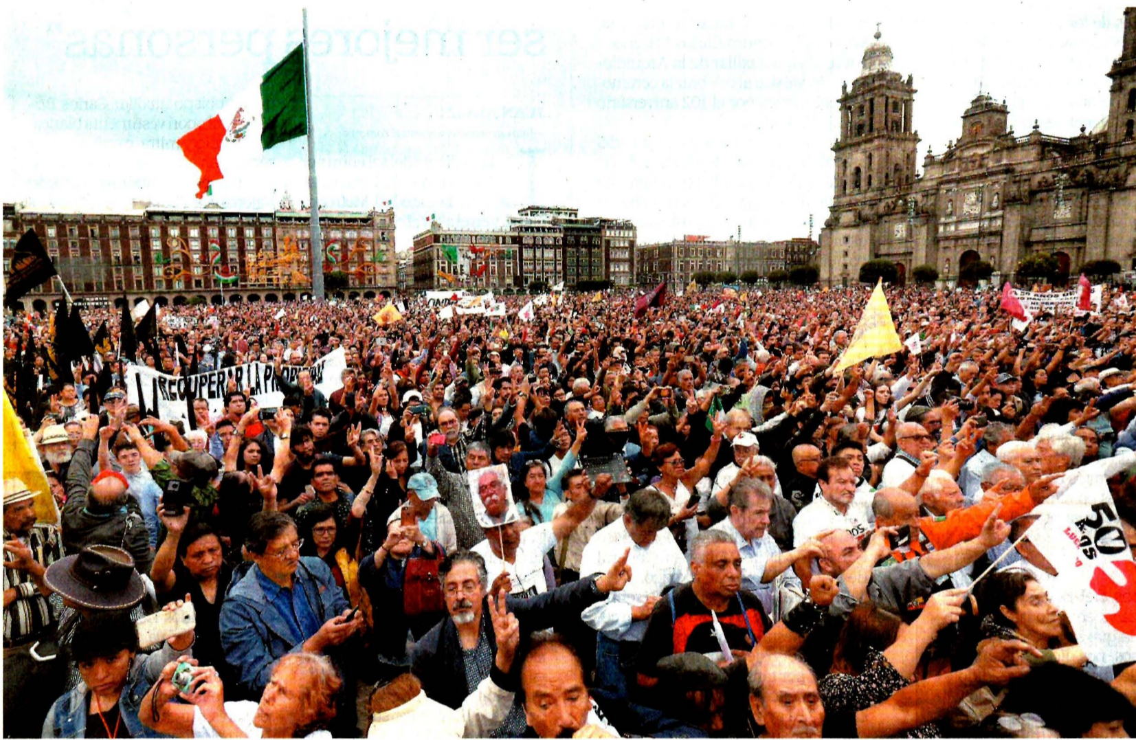
Las manos levantadas con la señal de victoria tapizaron el Zócalo. Noventa mil personas unieron sus voces para recordar que no habrá perdón ni olvido.