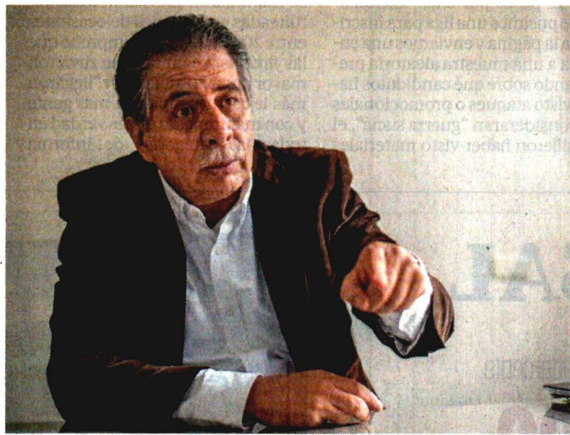
GERMÁN ESPINOSA. EL UNIVERSAL